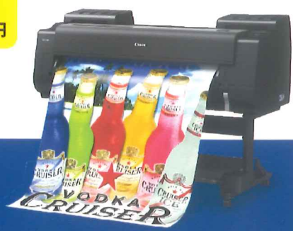
写真は imagePROGRAF PRO-4000S